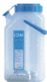
AMX – 塑料瓶 1.9ℓ AMX-1.9 1.8ℓ x 6,000次以上 (11,400ℓ) 消费者建议零售价： 家庭用1.9ℓ塑料瓶中有一套5个是 磁铁棒